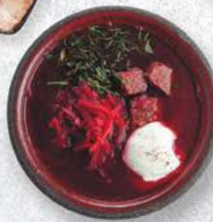
◀ БОРЩ 250 P BORSCHT