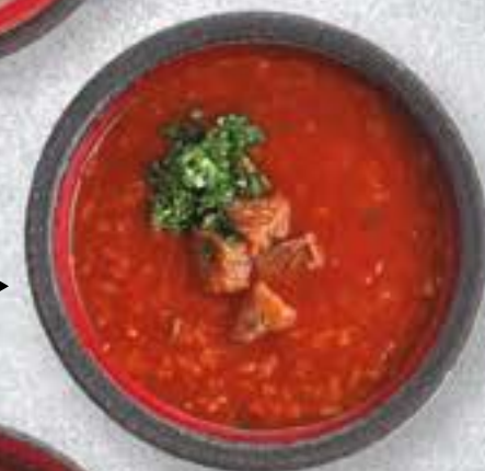
ХАРЧО ▶ 290 P KHARCHO