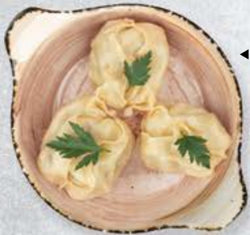
◀ МАНТЫ СО СВИНИНОЙ И КАРТОФЕЛЕМ 250 P PORK AND POTATO MANTI